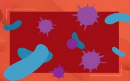
Są to wrota przez które może dojść do zarażenia INNymi CHOROBIAMI ZAKAŻNYMI