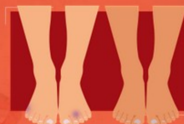
Bezwzględnie, GRZYBICA to POWAŻNY PROBLEM dla innych

CUKRZYCY ALERGICZNEGO ZAPALENIA SKÓRY ASTMY